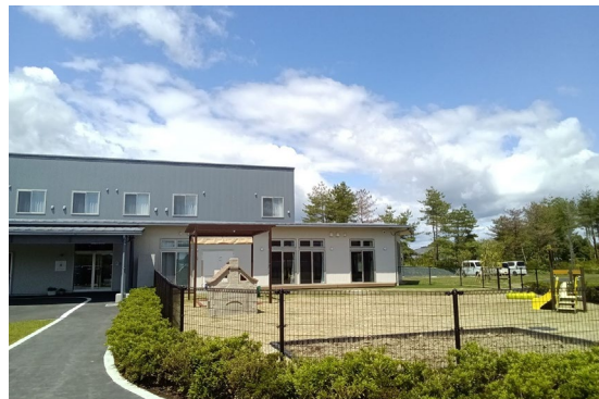
企業内保育園「オレンジリー岩手保育園」

岩手 BP0 フォートレス https://www.prestigein.com/company_profile/iwate_ichinoseki.html